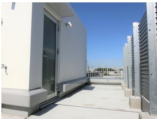
図面と現況が異なる場合は現況が優先となります。