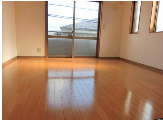
図面と現況が異なる場合は現況が優先となります。