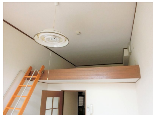
図面と現況が異なる場合は現況が優先となります。