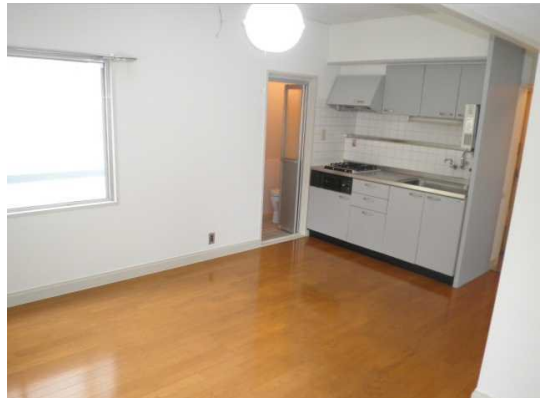
図面と現況が異なる場合は現況が優先となります。