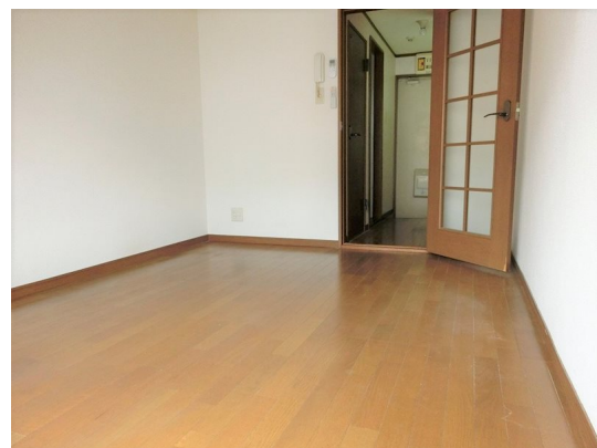
図面と現況が異なる場合は現況が優先となります。